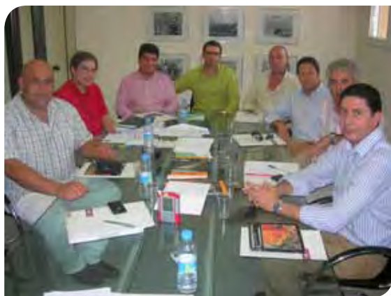
Cabezo Negro. Junta Directiva